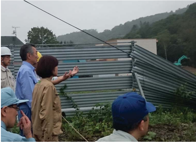
鉄道被害状況調査 【新得町内】