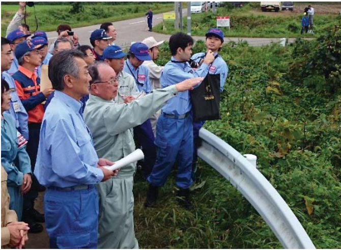
農地被害状況調査 【帯広市内】