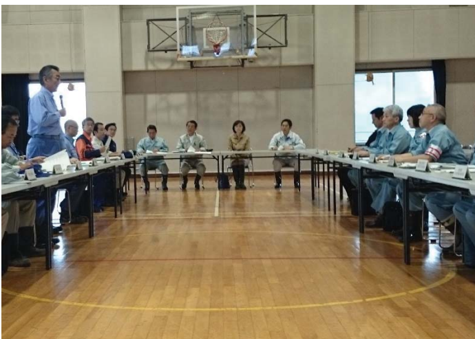
北海道知事との意見交換 【北海道十勝総合振興局】