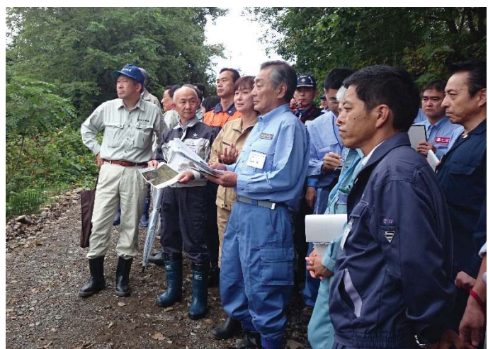
農地被害状況調査 【芽室町内】