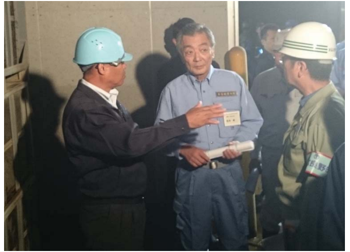
食品加工施設被害状況調査 【南富良野町内】