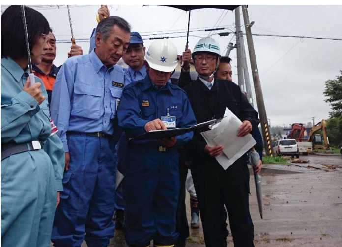
橋梁被害状況調査 【清水町内】