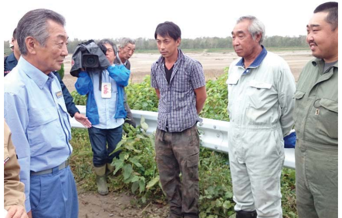
農地被害状況調査 【帯広市内】