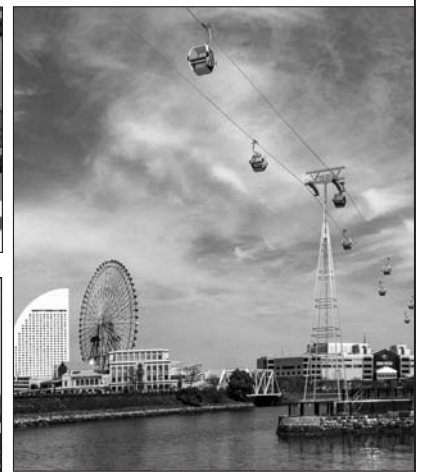
みなとみらい地区汽船道の上空に誕生するロープウェイ(完成予想画像)