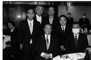
10/8 神奈川1区6区歯科医師連盟・薬剤師連盟懇談会 ●次回衆院選から上田勇前代議士は南関東ブロック比例に、遠山清彦衆議が6区に出馬へ。麻生太郎副総理・財務大臣がサプライズ出席しました!