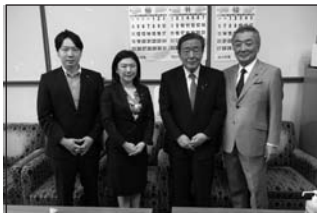
10/5 自民党本部青年局長挨拶 ●自民党青年局長の牧島かれん局長と小倉将信局長代理が自民党国対にご挨拶に。牧島衆議は自民党本部初の女性青年局長、牧島衆議は同じ政策集団「志公会」所属です。