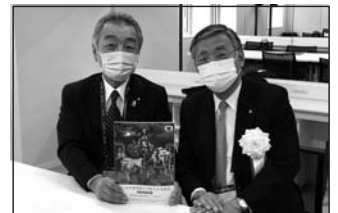
10/10 第53回日本薬剤師会学術大会開会式 ●山本信夫日本薬剤師会会長はじめ全国の薬剤師の先生が集い、コロナ感染拡大防止対策を徹底した、いつもと趣の異なる開会式になりました。