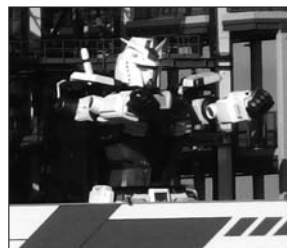
GUNDAM FACTORY YOKOHAMA

新型コロナ問題、このところ少しずつではありますが、人々の生活が正常化し始めています。Go To キャンペーンなどの効果もあり、横浜の街にも人が戻りつつあります。観光都市横浜、これを支えるインフラが観光資産であり、人々を楽しませるアミューズメントということになります。今回、横浜に新たな観光名所が生まれました。その一つが「GUNDAM FACTORY YOKOHAMA」(山下ふ頭)で、原寸大の動くガンダムを間近にみられる施設です。また、JR桜木町ビルの「旧横ギャラリー」ではわが国最古のSLの設置や鉄道の歴史を学ぶことができます。また、来春にはJR桜木町駅とみなとみらい21の運河パークを結ぶ都市型ロープウェイも完成予定です。従来の観光資源と連動し、大人も子供も楽しめる遊園地のような街が生まれようとしています。