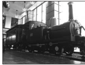
日本最古の110型蒸気機関車を展示