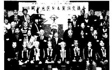
▲1/14 磯子区岡村地区連合町内会の新年会にて、力強い団結力が感じられました