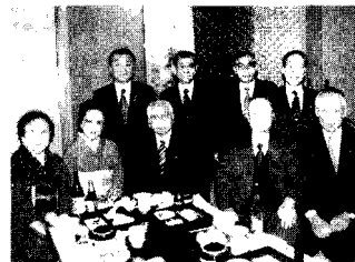
▲1/14 44年の歴史を誇る横浜吟友会・六浦吟詠会初吟会にて