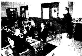
▲1/11 中区箕沢台自治会の新年会にて、国県市の各議員と意見交換が行われました