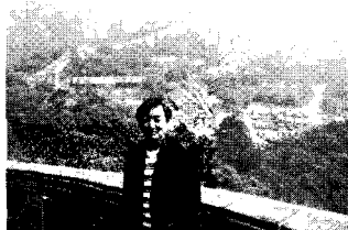
▲7/4 日中議会交流委員会で中国の「万里の長城」を視察