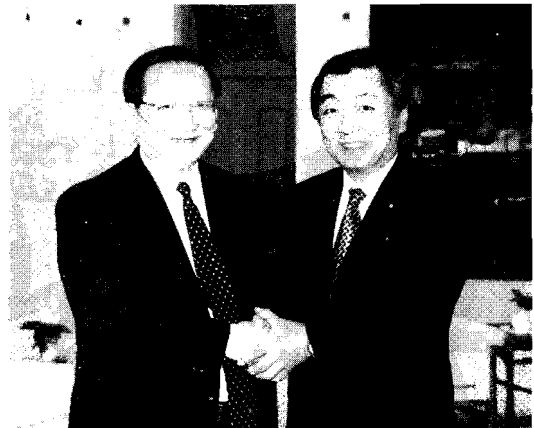
唐家璇國務委員と人民大会堂で会見しました

国連を舞台にした外交交渉は各国の思惑が錯綜するギリギリのせめぎあいでした。日米英仏など8カ国が制裁決議案を提出—中口両国が議長声明を主張して制裁決議案に対する拒否権発動を示唆—中口が非難決議案に歩み寄り。その背景にあったのは、拒否権を恐れない日本の毅然とした姿勢でした