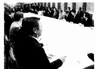
▲第1回政務官会議にて

「政務官2期目」スタートの日です。夜は中国大使館からのお招きで、お祝いにつけました。ホテルニューオータニの会場は人、人、人…。右肩あがりの経済成長が続く中国の勢いを感じさせるレセプションでした。王毅大使にご挨拶をと思いましたが、時間切れで残念!