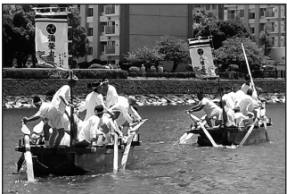
7/16 富岡八幡宮例大祭大祭式・祇園舟神事 ●横浜市は無形文化財第一号の夏越の祓えの神事です。青茅で造った五丁櫓の専用木造和船で一年分、十二本の御幣を立て諸々の罪穢を託して沖へ運びました。