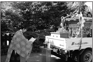
7/16 瀬戸神社天王祭祭典・巡幸祭 ●瀬戸神社・佐野和史宮司の祝詞奏上後、六浦地区氏子総代天王祭運営委員長と役員の方々と共に、発興祭に参列した松本純は各町内会を回る巡幸祭に向かいました。