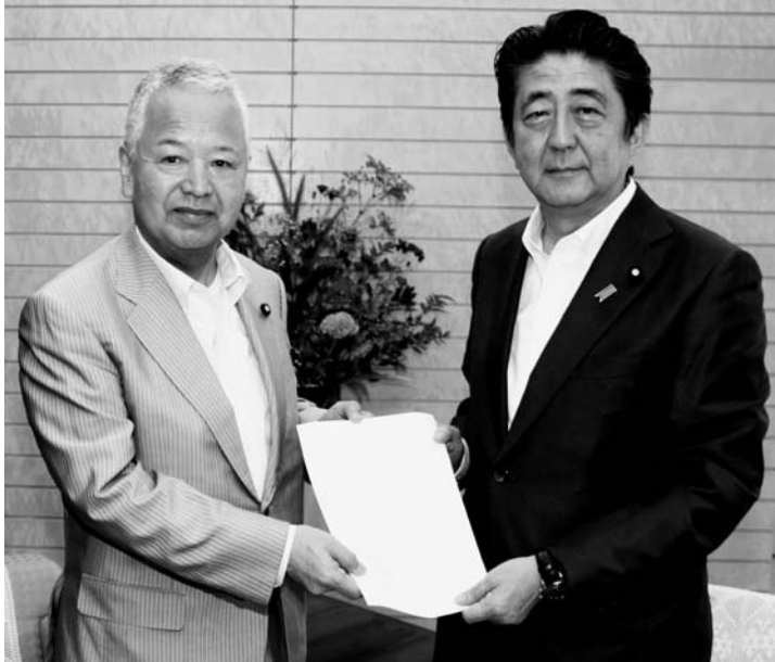
志公会として政策を総理に提言