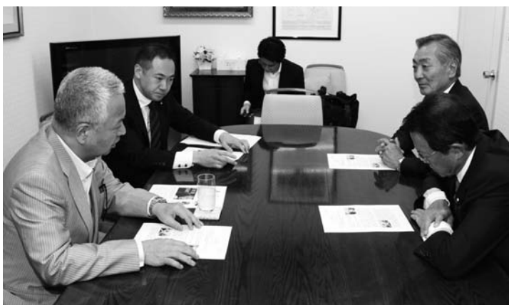
志公会での政策会議の様子