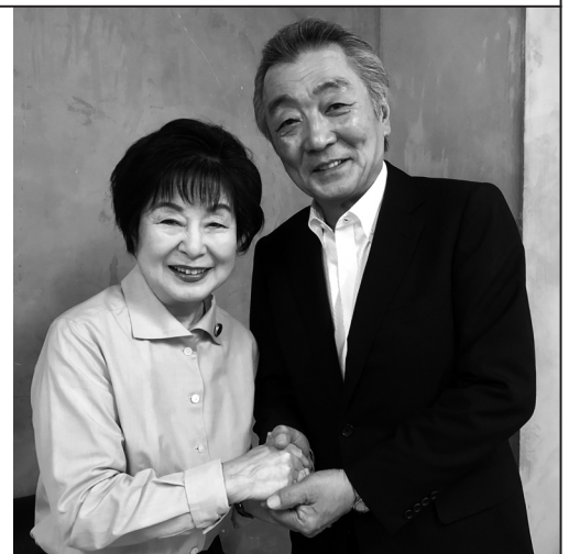
▲山東新参院議長とは「志公会」のお仲間です

就任にあたり、山東氏は『公正無私を旨とし、良き伝統とルールを守り、社会情勢に応じた思い切った改革をしながら、参院が言論の府としての役割を果たすべくこの身を尽くしてまいります』と抱負を述べられました。また、参議院自民党の人事は組閣と秋の臨時国会に合わせる形で行われる予定です。