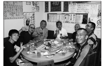
8/18 子之大神例大祭野毛2丁目直会●二日間の日程で開催された、私の生まれ育った野毛2丁目町内会の夏祭り。準備やあと片付けでご苦労された若手の皆さんの達成感の笑顔に触れられた野毛の熱き一日でした。