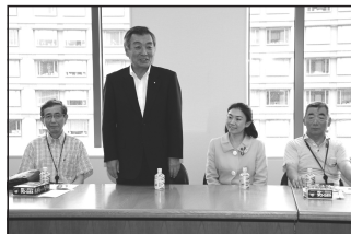
8/4 小田原薬剤師会との懇談会 牧島かれん衆議院議員主催の小田原薬剤師会との懇談会で医薬品ネット販売や社会保障制度の課題などをご報告。