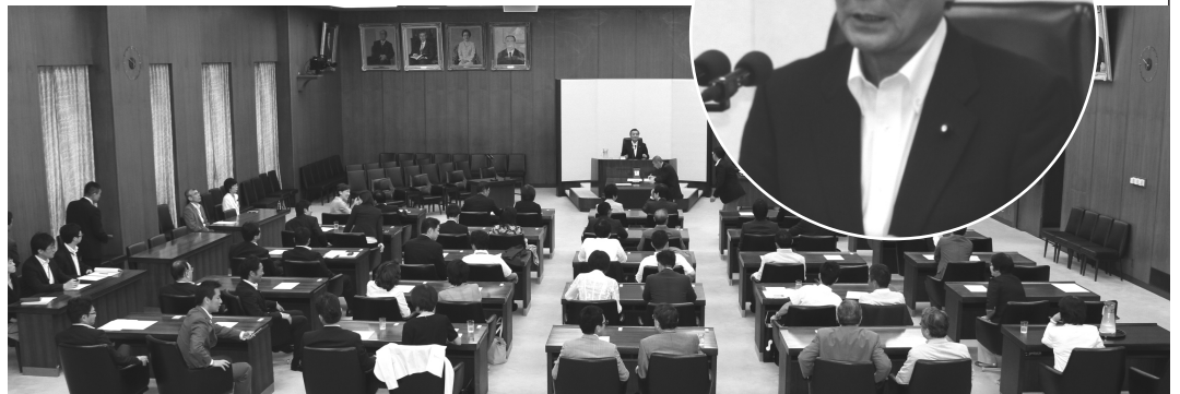
厚生労働委員会の委員長として、社会保障制度の充実に向け日々議論を続けています

その理由は社会保障制度の財源を確保し、将来も制度を維持していくために必要だからということに尽きます。日本の高齢化は急速に進行し、団塊の世代が75歳以上となる2025年には高齢者人口は3,657万人に達すると予測されています。