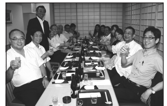
8/7 Jun Club 定例会・納涼会 私の市会議員時代からの後援会・Jun Clubの納涼会。臨時国会や横浜市長選挙への取り組みなどを報告しました。

「みんなの声」お寄せください ●あなたの「政治」への想いをFAXにてお寄せください ▷FAX 045-253-0585