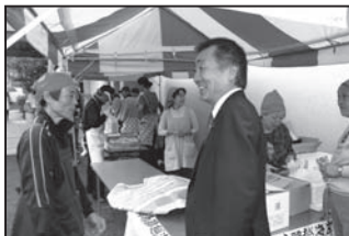
11/6 金沢東部ふれあい秋祭り 西柴小学校の生徒さんの合唱や様々なイベントが開催されにぎわいました