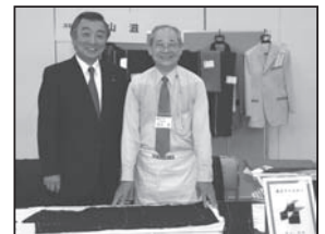
11/20 横浜マイスターまつり それぞれの卓越した技術を見出し、これぞ日本の底力と強く感じました

「みんなの声」お寄せください ●くらしを豊かにする「政治」を感じていますか? あなたの「政治」に対する想いをお寄せください