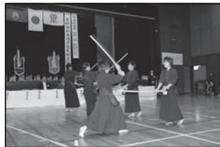
11/6 平成23年度秋季磯子区民剣道 練成大会 合同稽古で鍛えた区内の子供たちが神奈川県の大会で大活躍!