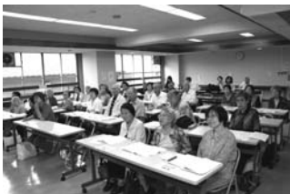
6/23 中区遺族会／先輩方の貴重なお話を次代に語り継がねばと痛感！