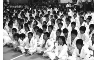
7/11 神奈川県柔道整復師会柔道大会／皆さんの健やかさと闘志に感激しました。