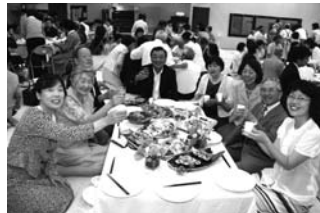
6/27 京浜金沢支部設立25周年記念朝起き会／元気の素を頂いています。