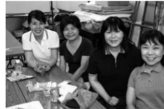
7/8 磯子純心会／スタッフとしてご協力いただいている素敵な皆さんです。