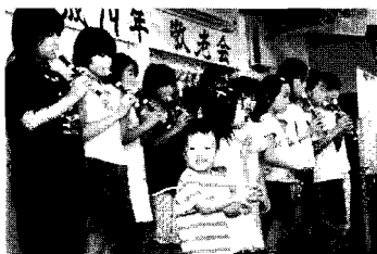
▲9/9 金沢区瀬ヶ崎西部町内会館 で恒例の敬老会に伺いました。