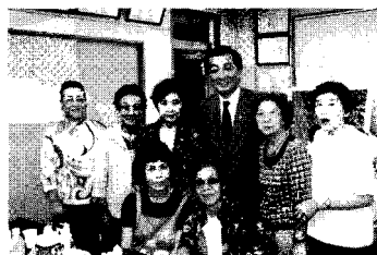
▲9/14 中区お三の宮お祭り「日枝 神社例大祭」の成功を祈って