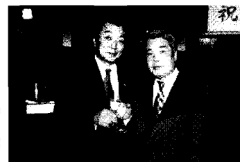
▲9/30 50周年を迎えられた中区 鍼灸マッサージ師会、太田会長と。