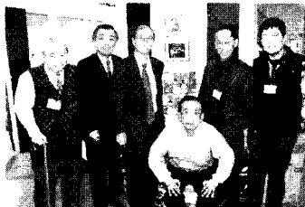
▲12/4 イセザキXmasパーティ。新年も益々の活力ある商店街へ