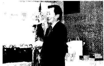
▲12/10 軟式野球並木リーグ連盟の納会で。並木Gチーム優勝を祝して