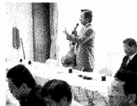
▲首都圏整備委員会にて