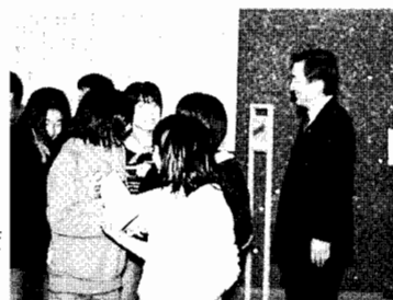
横浜市立滝頭小学校(磯子区) 児童120人の国会参観

41キロの体重があった中学3年の男の子が発見されたときには24キロ——大阪府岸和田市で起こった虐待事件はショックでした。相次ぐ虐待の背景には家族や地域社会の崩壊があると指摘されますが、自民党では小委員会でも児童虐待防止法の改正案を議論してきました。現在、詰め作業に入っており、今国会中に議員立法として改正案を提出する方針です。